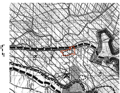
WYRYS ZE STUDIUM UMARUNKOWANI I KIERUNKÓW ZAGOSPODAROWANIA PRZESTRZENNEGO GMINY KWIDZYN