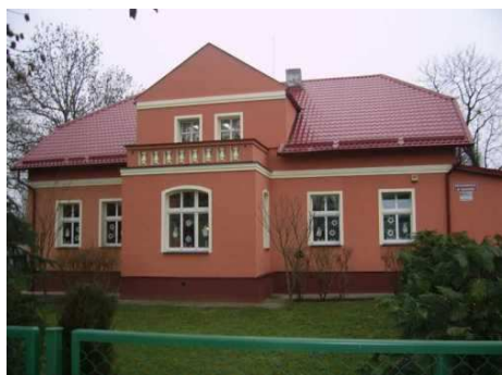
Przedszkole w Marezie z nowymi elewacjami