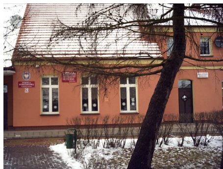
Budynek szkoły w Korzeniewie po termomodernizacji

Gmina Kwidzyn realizuje też od kilku lat inwestycje w partnerstwie z samorządem województwa, Powiatem Kwidzyńskim i Miastem Kwidzyn, w tym przede wszystkim w zakresie poprawy warunków bezpieczeństwa ruchu drogowego na terenie naszej Gminy. W roku 2008 dofinansowaliśmy dwie inwestycje samorządu województwa pomorskiego, w efekcie których wybudowano w ciągu drogi wojewódzkiej Kwidzyn-Iława nową zatokę autobusową zmodernizowano chodnik i wykonano nową kanalizację burzową na odcinku od kościoła do sklepu Gminnej Spółdzielni w Rakowcu oraz wybudowano dwie nowe zatoki autobusowe w Rozpędzinach przy drodze wojewódzkiej Kwidzyn - Sadlinki. Kolejną inwestycją, zrealizowaną w roku ubiegłym również w partnerstwie z inną jednostką samorządu terytorialnego – Powiatem Kwidzyńskim jest modernizacja drogi powiatowej Licze – Bronno – Otoczyn o dł. 1300 mb wraz z chodnikiem na odcinku 400 mb. Wcześniej, przy udziale środków przekazanych naszej gminie przez samorząd Miasta Kwidzyna, wybudowano most dla pieszych przez Liwę w Górkach i ścieżkę pieszo-rowerową z Marezy do Korzeniewa.