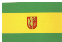
Herb i flaga Gminy Kwidzyn