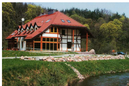
Szadowski Młyn, siedziba Ośrodka Wolontariatu Fundacji „Wielka Orkiestra Świątecznej Pomocy”