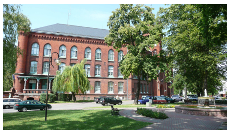
Gmach Urzędu Gminy Kwidzyn

Gmina Kwidzyn obejmuje powierzchnię 207 km 2 . W gminie zamieszkuje 10 697 osób, w tym 5435 mężczyzn i 5262 kobiety. Na 100 mężczyzn przypada 97 kobiet. Na terenie Gminy znajdują się 34 miejscowości zamieszkałe, z których największe to Rakowiec (1375 mieszkańców), Mareza (1150), Tychnowy (708), Korzeniewo (677), Licze (524) i Górki (504). Liczbę mieszkańców w poszczególnych miejscowościach przedstawia poniższa tabela: