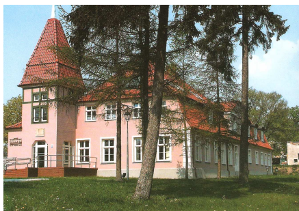
Dwór w Górkach po odrestaurowaniu przez nowego właściciela – Fundację „Misericordia”; mieści się tu Warsztat Terapii Zajęciowej dla osób niepełnosprawnych