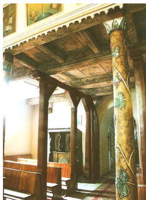
Wnętrze kościoła parafialnego p.w. Św. Jerzego w Tychnowach

Zadania gminy finansowane są ze środków własnych gminy, z subwencji i dotacji z budżetu państwa oraz ze środków pozyskanych z innych źródeł, w tym z Unii Europejskiej. Budżet Gminy Kwidzyn na rok 2008 wyniósł 25 714 884 zł po stronie dochodów, a wydatki zamknięto kwotą 29 198 857. złotych. Największą część wydatków stanowią wydatki na oświatę i wychowanie – 10,5 mln złotych; na pomoc społeczną wydatkowano w roku 2008 ponad 5 mln 600 tys. złotych (łącznie z dodatkami mieszkaniowymi i świadczeniami rodzinnymi); na kulturę fizyczną i sport 365 tys. zł, na kulturę i ochronę dziedzictwa narodowego 964 tys. zł. W tym miejscu należy podkreślić, iż od 2008 roku Gmina Kwidzyn udziela dotacji na prace konserwatorskie i restauratorskie przy zabytkach wpisanych do wojewódzkiego rejestru zabytków. W ubiegłym roku dofinansowano prace przy zabytkowych kościołach w Rakowcu i w Tychnowach, udzielając parafiom w tych miejscowościach dotacji w kwotach po 50 tys. złotych