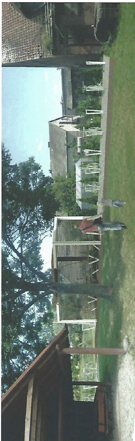
Rysunek 15 Rowerowe miejsce postojowe w Mątowych Wielkich – wizualizacja 1.