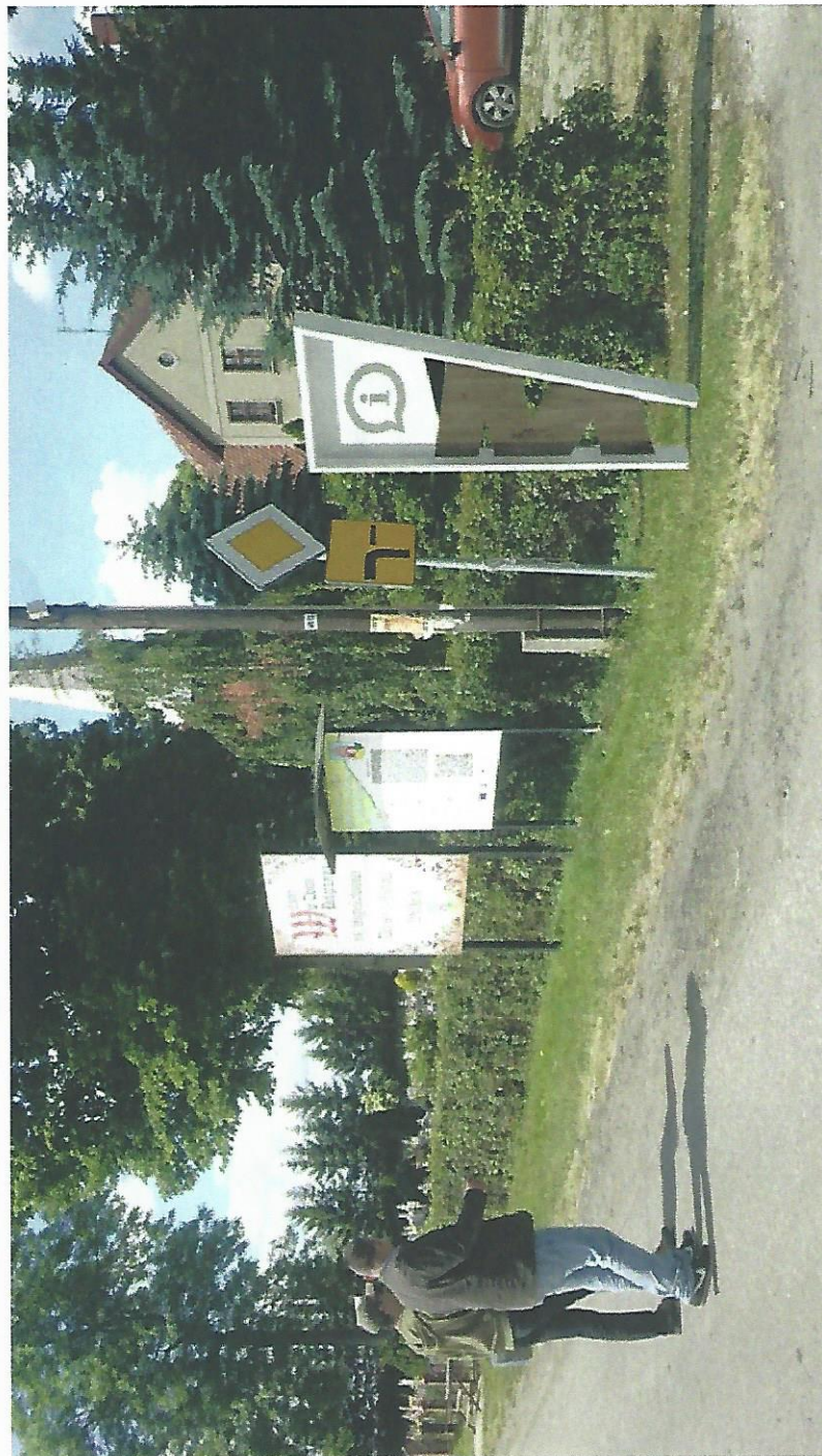
Rysunek 16 Rowerowe miejsce postojowe w Mątowych Wielkich – wizualizacja 2.